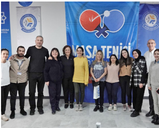
LHÜ Spor Kulübü Etkinlikleri Devam Ediyor » 4'te

» Sağlık ve ilaç odaklı olarak faaliyet yürütecek Lokman Hekim Üniversitesi Sağlık ve İlaç Teknoloji Merkezi (LHUSTEK) resmi açılışı Sanayi ve Teknoloji Bakanı Sayın Mustafa VARANK'ın katılımı ile gerçekleştirildi. » Devamı 2'de