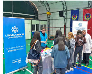
Üniversite Adayı Öğrenciler ile Buluşuyoruz » 11'de