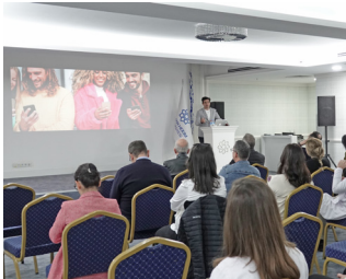
Dental Fotoğrafçılık Eğitimi Gerçekleştirildi » 7'de