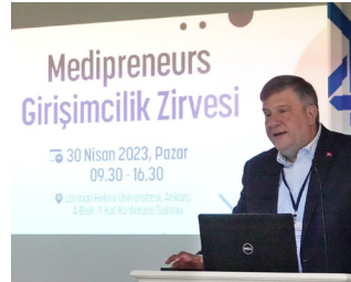
LHUSTEK Sağlıkta Girişimcilik Zirvesi Gerçekleştirildi » 6'da