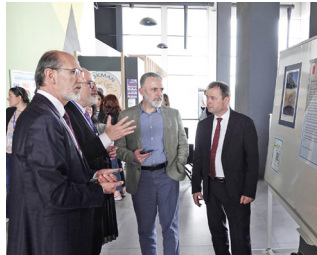
TÜBİTAK Projesi Kapsamında Tıp Fakültesi Çalıştayı Gerçekleştirildi » 5'te