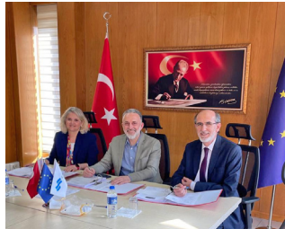
Eczacılık Fakültemizin Önemli Başarısı » 9'da